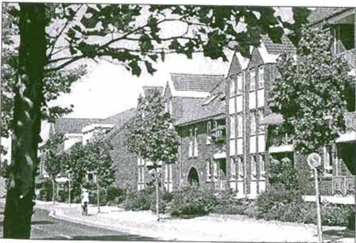
Gelungene Sanierung: An der Bahnhofstraße sind schmutzige Wohnhäuser entstanden.

Oberbürgermeister Eberhard Menzel sagte gestern gegenüber der „Wilhelmshavener Zeitung“ zu, die Rechtslage noch einmal prüfen zu wollen, sobald die Bürger eine Eingabe bei der Stadt machen. Er werde das Thema nach der Sommerpause in die Gremien der Stadt zur Beratung vorstellen.