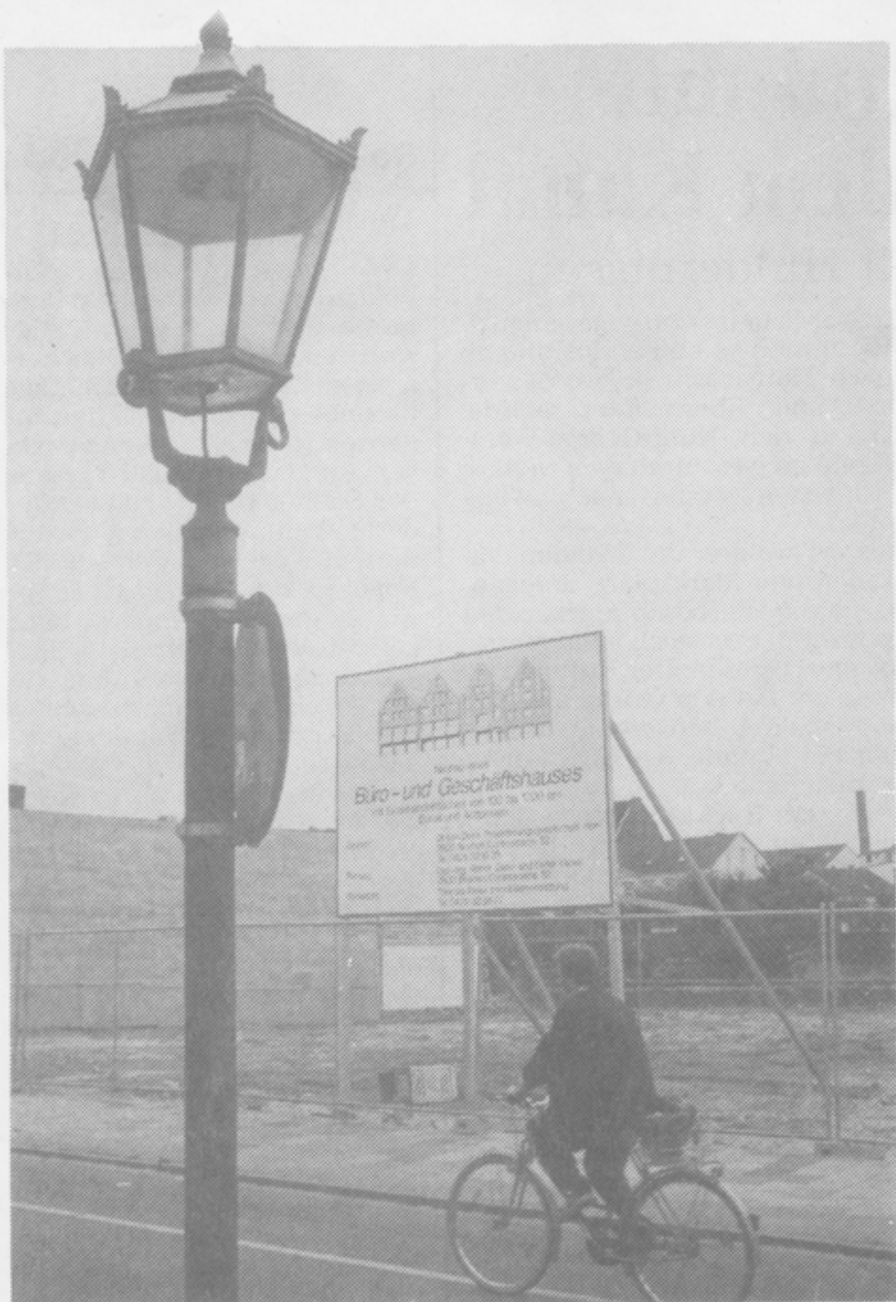
Das Bauschild steht bereits. Der Bauantrag ist gestellt und in diesem Herbst soll mit dem Neubau der Büro- und Geschäftshäuser Marktstraße 116 bis 120 bereits begonnen werden.